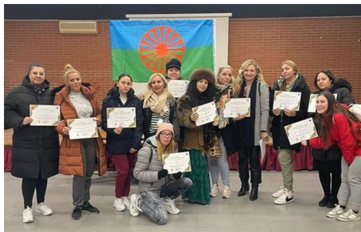
Entrega de diplomas en Pan Bendito. 24 de enero 2023.